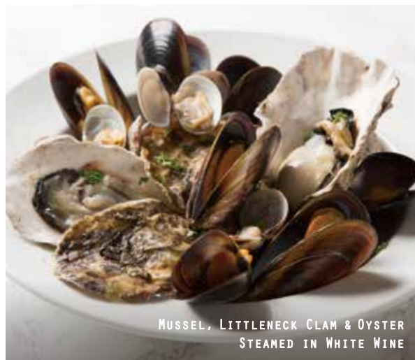
MUSSEL, LITTLENECK CLAM & OYSTER STEAMED IN WHITE WINE