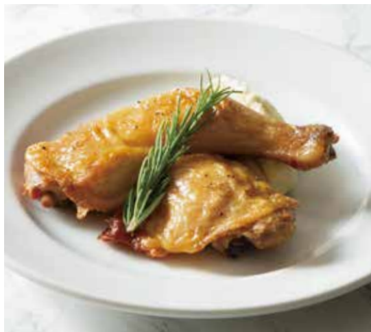
CHICKEN THIGH CONFIT