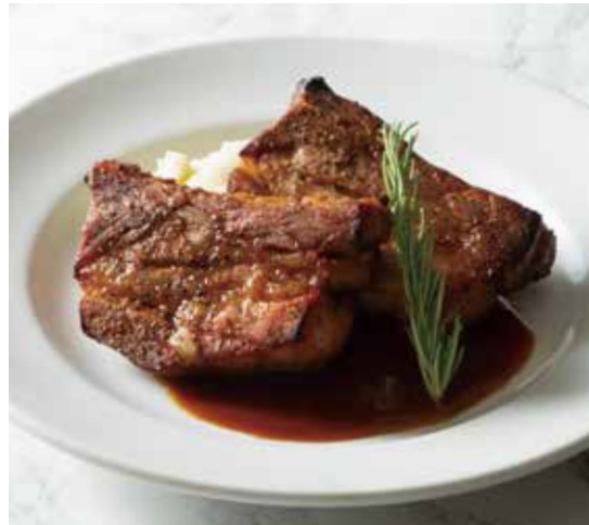
PORK SPARE RIB ポークスペアリブ