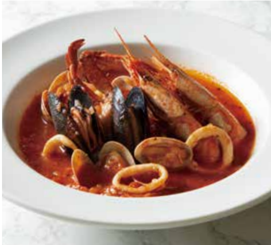
SEAFOOD TOMATO STEW シーフードのトマト煮