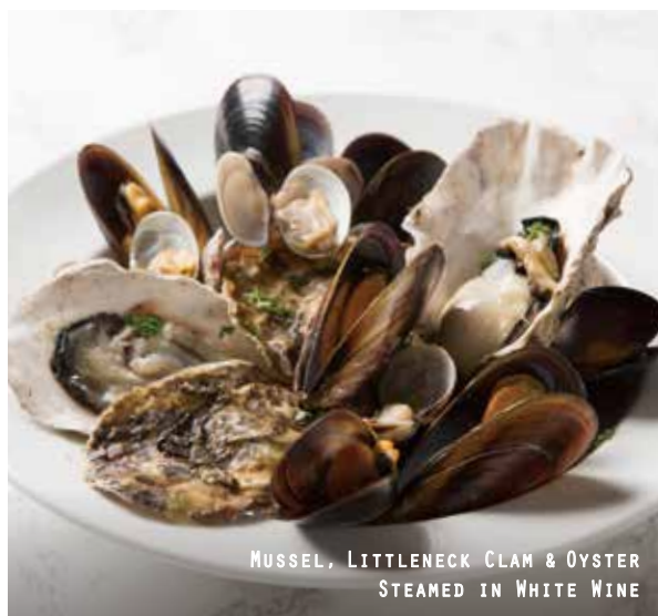
MUSSEL, LITTLENECK CLAM & OYSTER STEAMED IN WHITE WINE