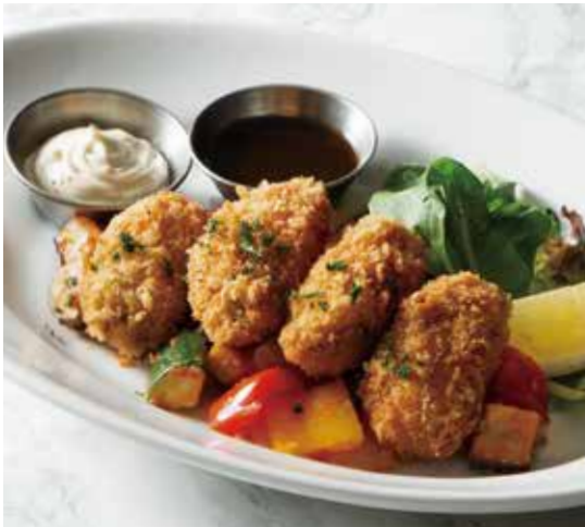
FRIED OYSTER 牡蠣フライ