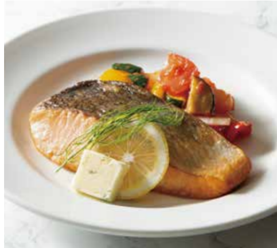
GRILLED SALMON TROUT グリルサーモントラウト