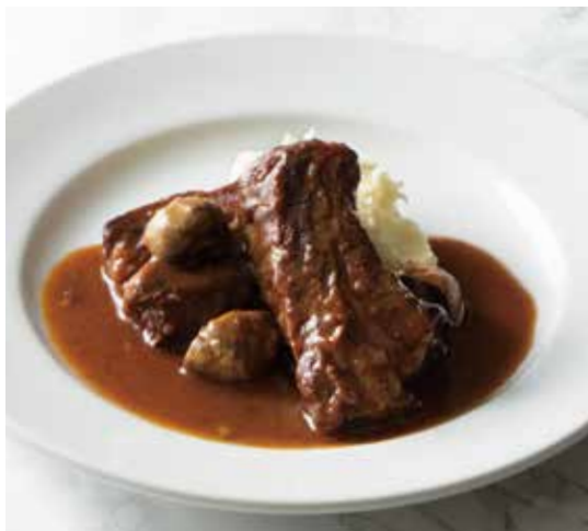
BEEF BRISKET STEW