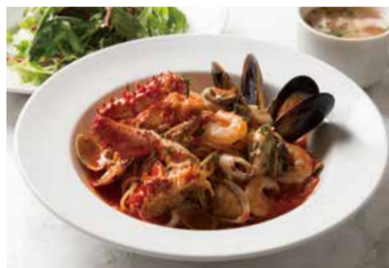
SPAGETTI WITH OYSTER, CRAB & TOMATO SAUCE ... 1,290 牡蠣と蟹のペスカトーレ