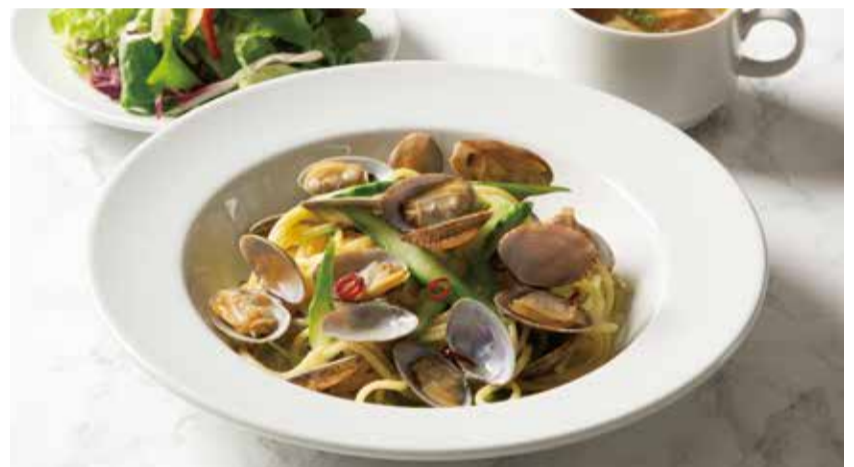
SPAGETTI WITH CLAM & OLIVE OIL ..... 1,190 ボンゴレピアンコ