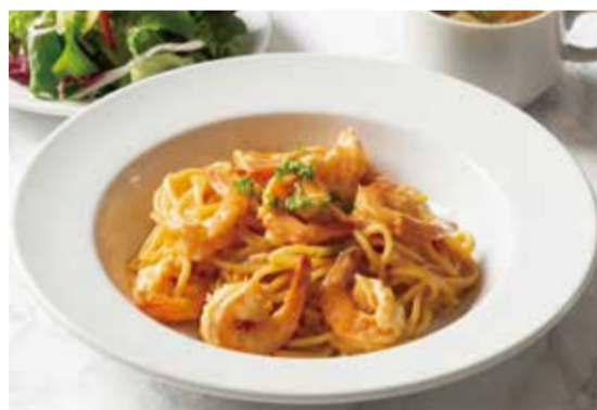
SPAGETTI WITH SHRIMP & BISQUE SAUCE ..... 1,290 海老のビスクソース