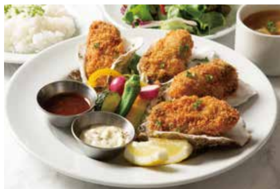
FRIED OYSTER PLATE ..... 1,390 国産牡蠣フライプレート

with Salad, Soup & Drink / サラダ・スープ・ドリンク付き