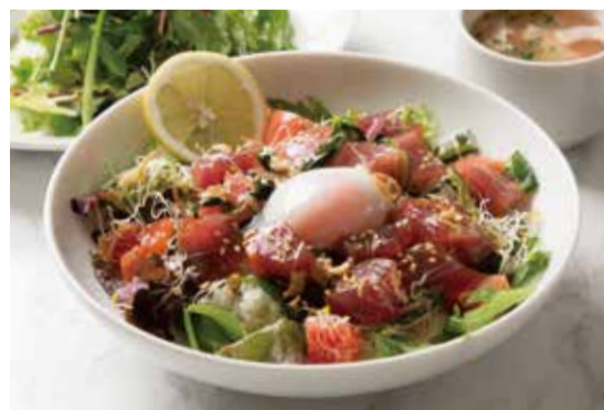
POKE BOWL ..... 1,190 ポキボウル