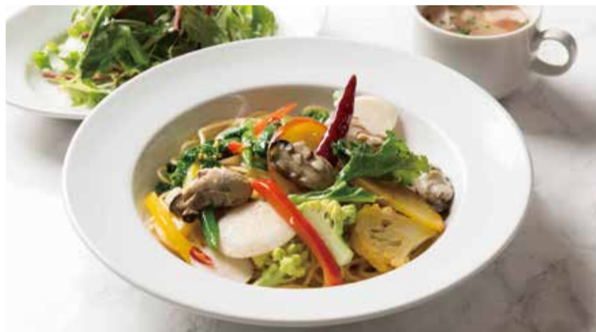
SPAGETTI WITH OYSTER, VEGETABLE & CHILI OIL ... 1,190 牡蠣と三浦野菜のペペロンチーノ

with Salad, Soup & Drink / サラダ・スープ・ドリンク付き