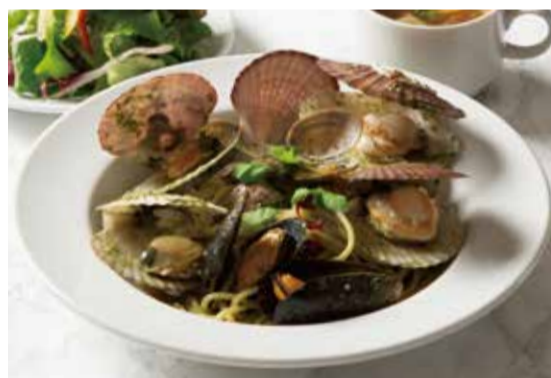
SPAGETTI WITH SCALLOP, MUSSEL, CLAM & BASIL SAUCE ... 1,240 帆立、ムール貝、アサリのバジルソース