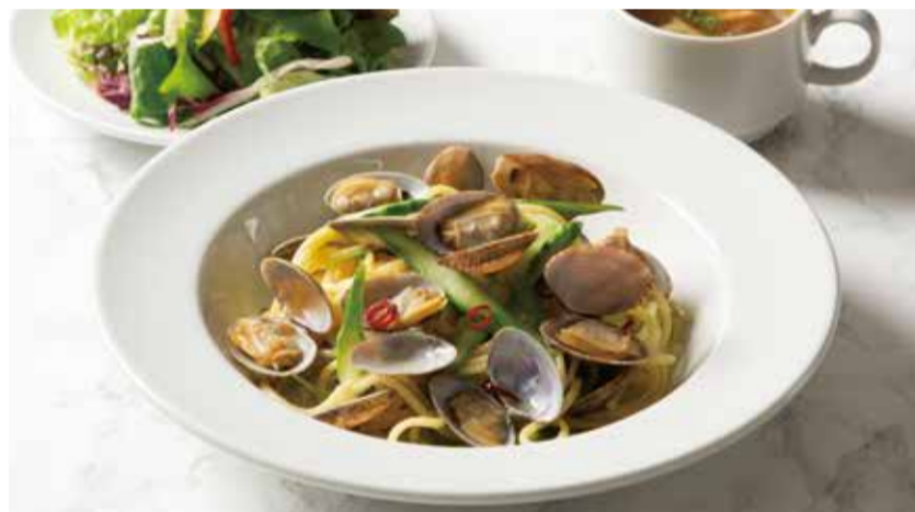
SPAGETTI WITH CLAM & OLIVE OIL ..... 1,190 ボンゴレピアノ