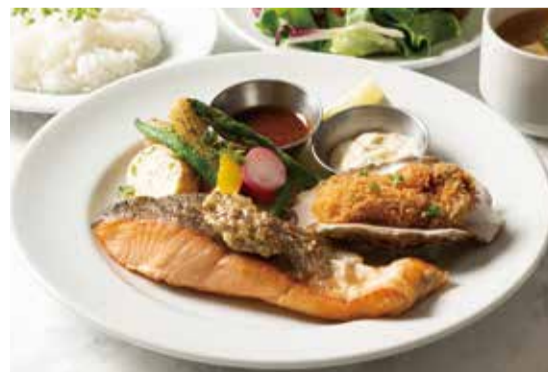
FRIED OYSTER & SALMON PLATE ..... 1,440 国産牡蠣フライとサーモンプレート